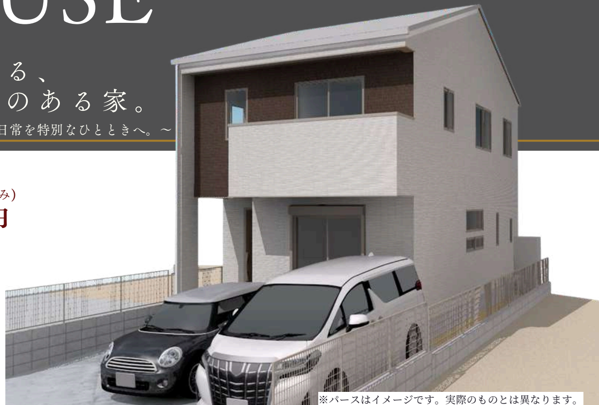
※パースはイメージです。実際のものとは異なります。

フォーブル平和台線 安西中学校バス停 (約200m) 徒歩約3分 安西小学校 (約350m) 徒歩5分 安西中学校 (約400m) 徒歩5分 鮮Do! エブリィ長楽寺店 (約950m) 車で約4分 くすりのレディ長楽寺店 (約800m) 車で約4分