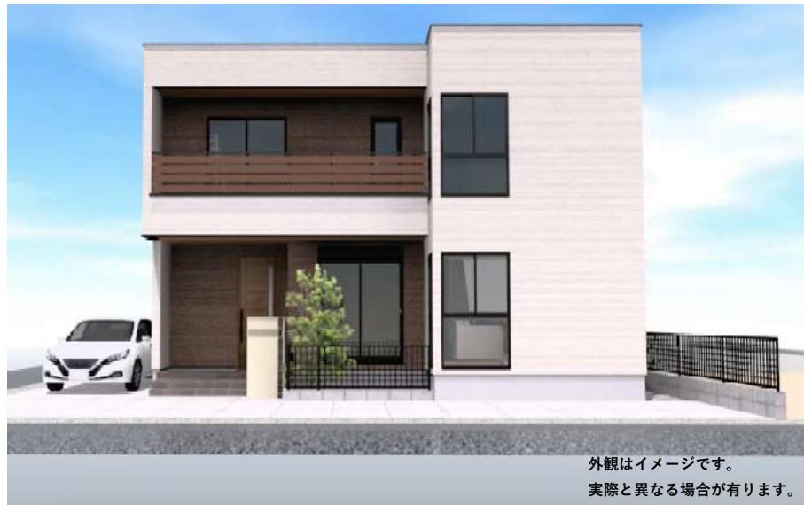
外観はイメージです。 実際と異なる場合があります。